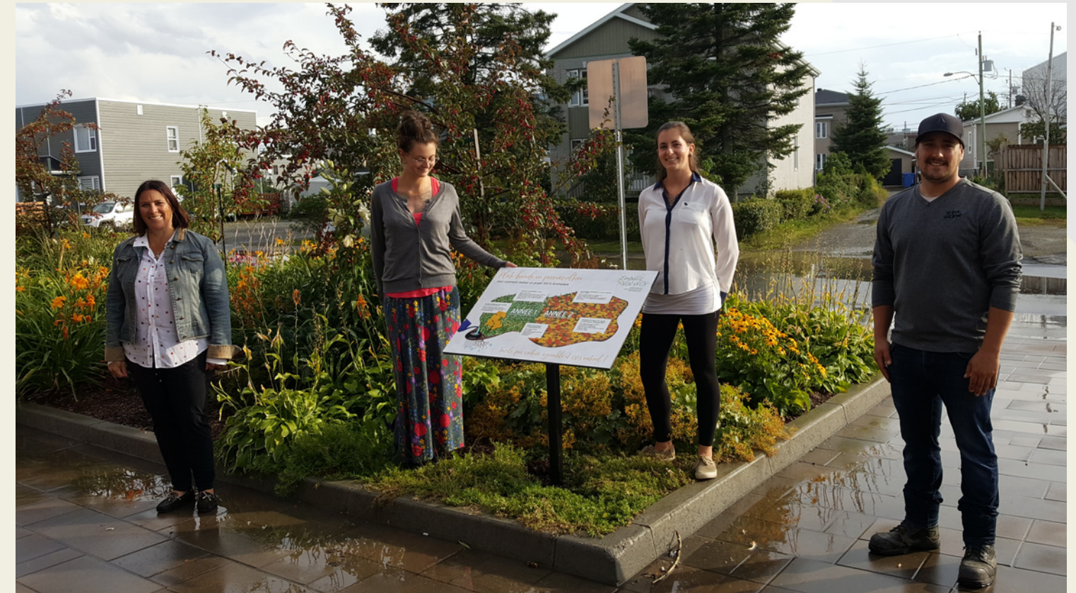
1er septembre 2020 - Inauguration de la plaque de la permaculture, lors d'un 5 à 7.

Réalisation de la plaque d'information portant sur la PERMACULTURE, laquelle a été installée à la plate-bande du centre au Marché Public, à la fin juin; cette plaque (comprenant texte et images) porte sur cette technique simple et peu coûteuse ne comprenant aucun engrais chimique, aucun pesticide, aucun compost ou paillis commercial; de ce fait, un minimum d'entretien est requis, les coûts sont minimes et les résultats sont au rendez-vous.